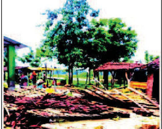
ବର୍ଷାରେ ସାଫ୍ଟିକ୍ ହାଟ ଛୁଟିକାର ହେତୁ ୭ ଜଣ ଲୋକ ଆହତ ହୋଇଛନ୍ତି।

ରାଉରକେଲା, ୧୭/୦୮ (ନି.ପ୍ର): ବର୍ଷାରେ ସାଫ୍ଟିକ୍ ହାଟ ଛୁଟିକାର ହେତୁ ୭ ଜଣ ଲୋକ ଆହତ ହୋଇଛନ୍ତି।