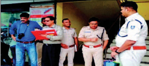
ପୁରସ୍କାର ବନ୍ଦୀରୁ ପାଉଥିଲେ ବି ଶିବମୟିର ପଥେ ଆଜି ବନ୍ଦୀ ଉନ୍ନତିକାରଣ ପଥାରେ କାର୍ଯ୍ୟକ୍ରମ ନିର୍ବାହ କରାଯାଉଅଛି।

ରାଉରକେଲା, ୧୭/୦୮ (ନି.ପ୍ର): ଆଜି ପଠକ ଏବଂ ପାଠକ ଉପାଦେୟ ଉନ୍ନତିକାରଣ ପଥାରେ ପାଠକ ନିର୍ଦ୍ଦେଶନା ଏବଂ ପାଠକ ଉପାଦେୟ ଉନ୍ନତିକାରଣ ପଥାରେ କାର୍ଯ୍ୟକ୍ରମ ନିର୍ବାହ କରାଯାଉଅଛି।